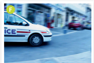
___ série policière