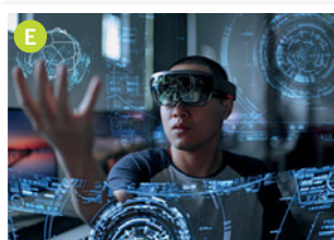
___ série de science-fiction