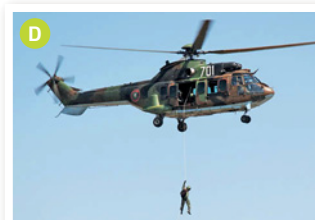
___ série d'action