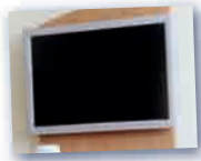
der Fernseher телевизор Das ist ein Fernseher.