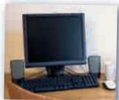
der Computer компьютер Das ist ein Computer.