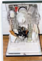
die Spülmaschine посудомоечная машина Das ist eine Spülmaschine.