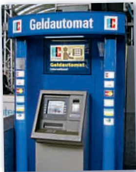
der Geldautomat банкомат