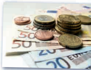
das Geld деньги