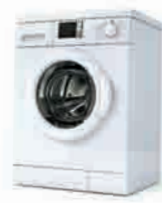
die Waschmaschine стиральная машина Das ist eine Waschmaschine.