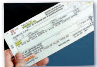
die Fahrkarte проездной билет