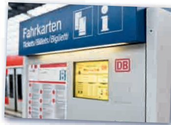
der Fahrkartenautomat автомат для продажи проездных билетов