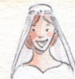
die Braut bride