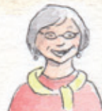
die Oma grandma