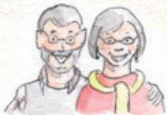
die Großeltern grandparents