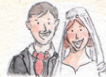
das Hochzeitspaar bride and groom