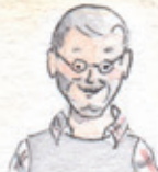
der Opa grandpa