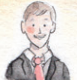
der Bräutigam groom