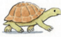
die Schildkröte kaplumbağa