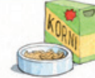
das Körnerfutter yem