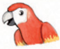
der Papagei papağan