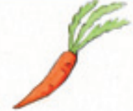
die Karotte havuç