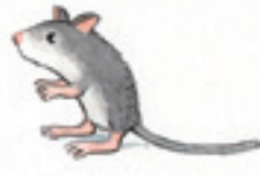
die Wüstenrennmaus çöl faresi