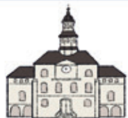
das Rathaus ратуша