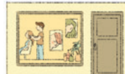
der Friseursalon перукарня