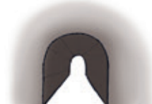
der Tunnel тунель