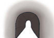
der Tunnel тунель