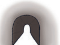
der Tunnel el túnel