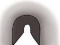
der Tunnel el túnel