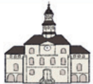
das Rathaus el ayuntamiento