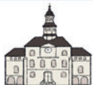
das Rathaus ратуша