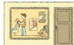
der Friseursalon парикмахерская