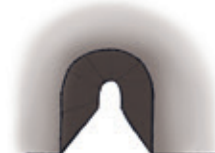
der Tunnel туннель