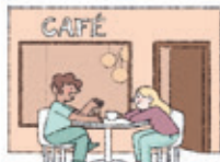
das Café cafeneaua