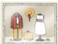
das Schaufenster vitrina