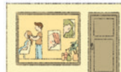
der Friseursalon salonul de coafură