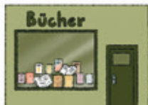
der Buchladen librăria