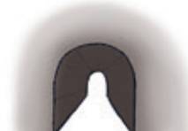
der Tunnel tunelul