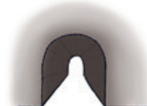
der Tunnel tunnel