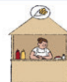
die Imbissbude budka z jedzeniem