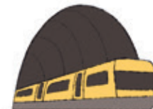
die U-Bahn metro