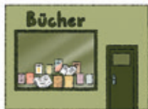
der Buchladen księgarnia