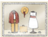
das Schaufenster wystawa