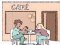
das Café kawiarnia