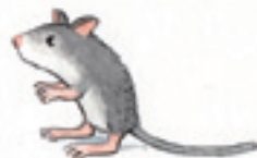
die Wüstenrennmaus la gerbille