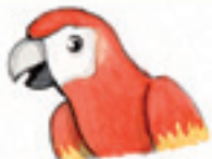
der Papagei le perroquet