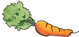
die Karotte havuç