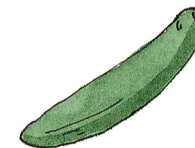
die Gurke el pepino