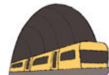
die U-Bahn la metropolitana