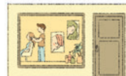
der Friseursalon il salone di parrucchiere