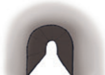
der Tunnel la galleria