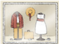
das Schaufenster la vitrine