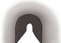
der Tunnel le tunnel