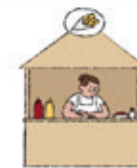
die Imbissbude la friterie