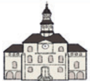
das Rathaus l'hôtel de ville