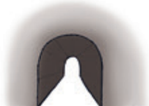
der Tunnel le tunnel