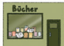
der Buchladen la librairie