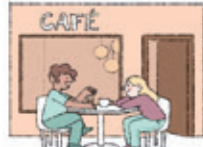
das Café coffee shop