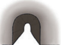
der Tunnel tunnel