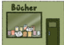
der Buchladen bookstore