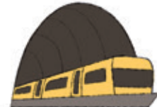
die U-Bahn subway