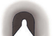
der Tunnel tunnel