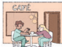
das Café coffee shop