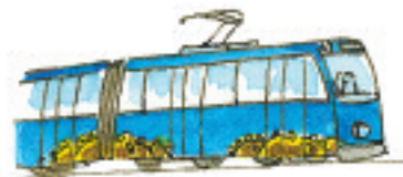
die Straßenbahn el tranvía