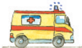
der Krankenwagen la ambulancia