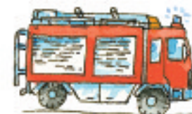
das Feuerwehrauto el camión de bomberos