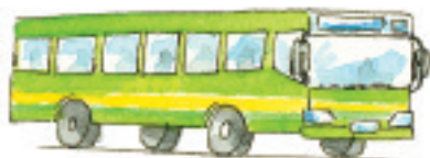
der Bus el autobús