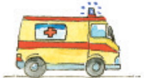
der Krankenwagen l'ambulance