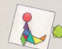
das Tangram-Spiel jocul Tangram