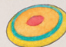
die Frisbee-Scheibe discul de Frisbee