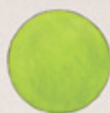
der Kreis cercul