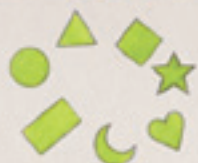
die Formen formele