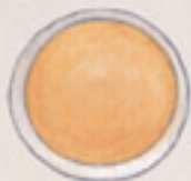
der Pfannkuchen clătita