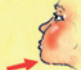
das Kinn çen