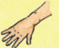
die Hand dest