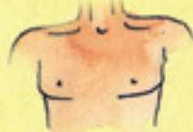
die Brust sîng