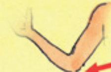
der Ellenbogen enîşk