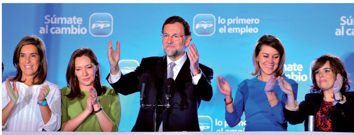
Saludo de Mariano Rajoy tras el triunfo del Partido Popular en las elecciones de noviembre de 2011.

ancho del país. La reducción de la financiación en estas áreas, consideradas intocables hasta estos momentos de crisis intensa, provocan una oleada de protestas provenientes de todos los foros.