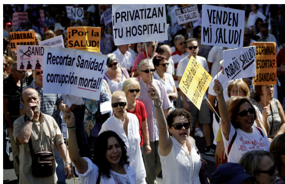
Manifestación en contra de los recortes en la sanidad pública.

Es importante comprender que la combinación de fuertes recortes sociales, elevados niveles de desempleo y corrupción, es una mezcla potencialmente explosiva que puede generar brotes de violencia en el país. Aunque el pueblo español no es dado a reaccionar con agresividad ante situaciones extremas, la larga duración de la crisis económica pone a prueba el aguante de muchas familias y de la sociedad en general.