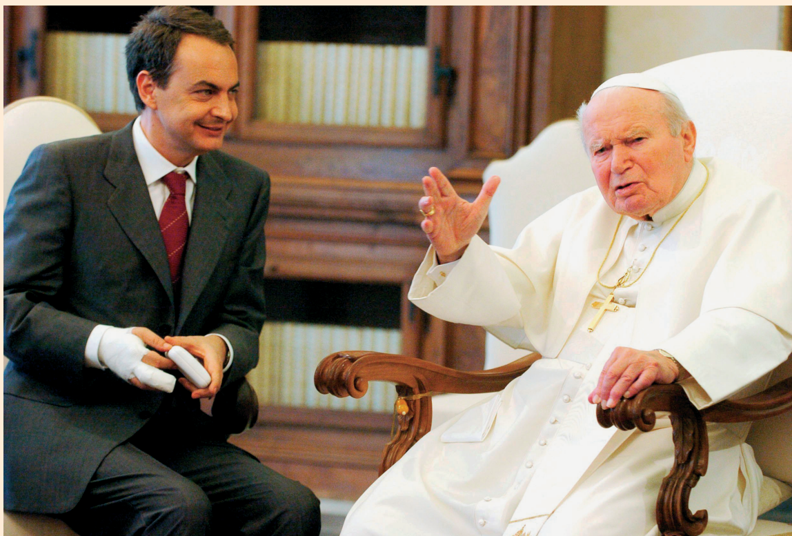
Entrevista de Rodríguez Zapatero con el papa Juan Pablo II.