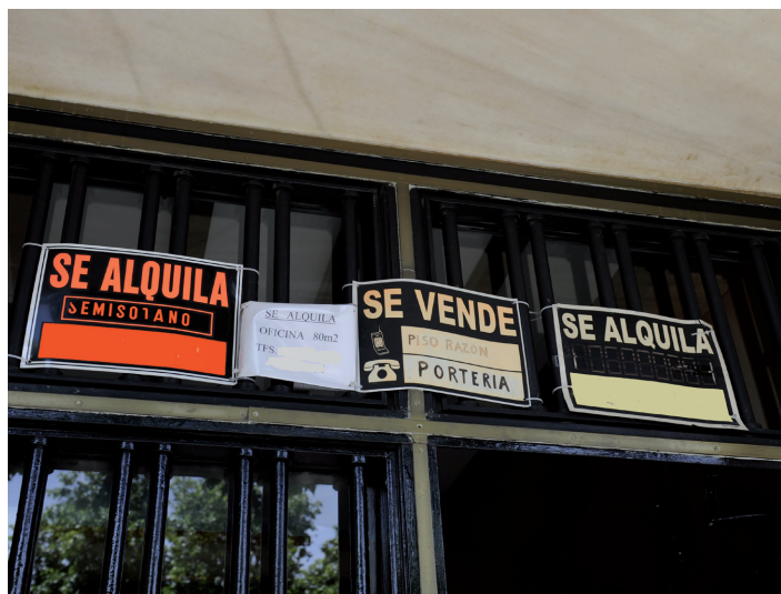
El sector inmobiliario se desploma.

críticas por su gasto público desmesurado y por no haberlo contenido al comienzo de la crisis.