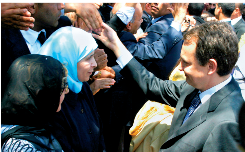
Reorientación de la política exterior. Visita oficial de Zapatero a Marruecos.

La decisión de retirar las tropas de Irak rompe las buenas relaciones que se habían desarrollado entre España, EE. UU. y Gran Bretaña durante el gobierno del PP; de hecho, las relaciones con EE. UU. no recobrarán su normalidad hasta cinco años después. El PSOE decide reorientar sus vínculos hacia los países aliados tradicionales, volviendo al eje UE-América Latina-Norte de África, que había sufrido un alejamiento de España con el gobierno anterior. Las relaciones con estos países se ven muy mejoradas a través de conversaciones y viajes oficiales del presidente para estrechar lazos.