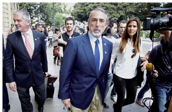
Francisco Correa, principal acusado de uno de los mayores escándalos de corrupción que afectan al PP.