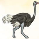
der Strauß النَّعَامَةُ