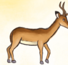
die Antilope الطَّبْي