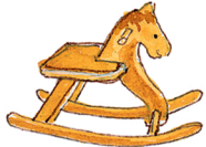
das Schaukelpferd الحصانُ الهزاز