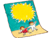
das Poster المُلصقات