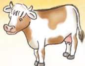
die Kuh الْبَقْرَةُ