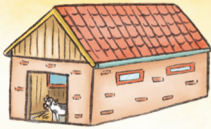
der Stall الإسْطَبَلُ