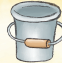
der Eimer الدَّلْوُ