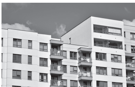
7 El a _ a _ _ a _ _ n _ o