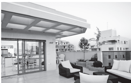
1 El á _ i _ o