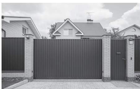
6 El c _ a _ e _