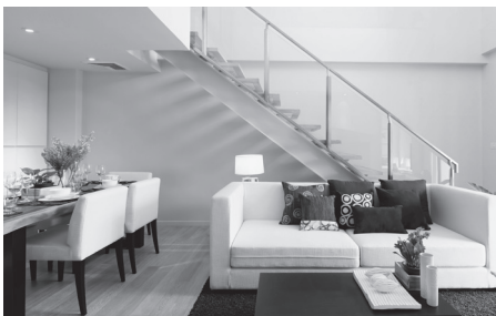
4 El _ ú _ _ x