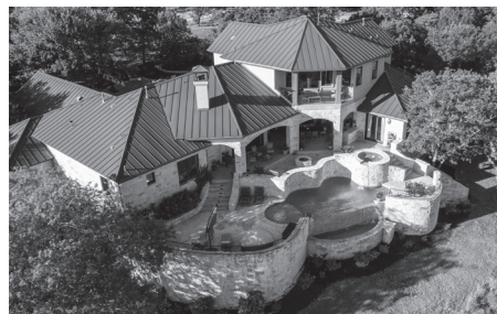
5 La m _ _ s _ ó _