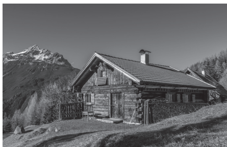
2 La c _ b _ ñ _