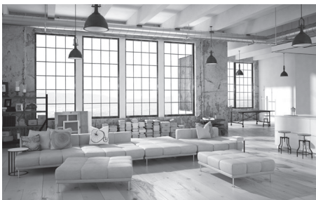
3 El l _ _ t