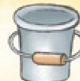
der Eimer ведро