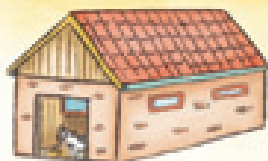
der Stall стойло