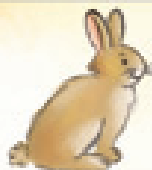
das Kaninchen кролик