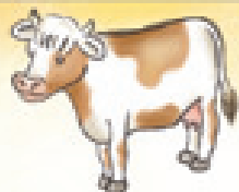
die Kuh корова