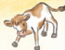
das Kalb телёнок