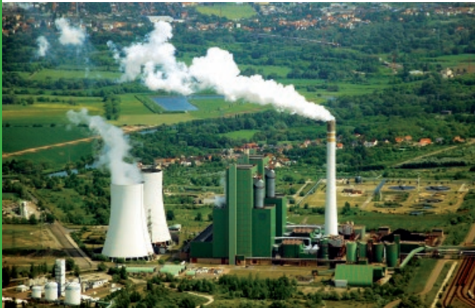
Braunkohlekraftwerk Schkopau (Sachsen-Anhalt)