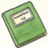
das Klassenbuch sınıf defteri