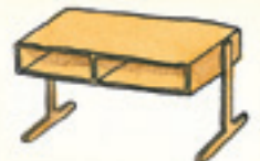
der Schreibtisch il banco