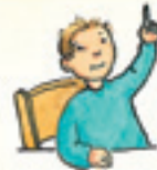
sich melden alzare la mano