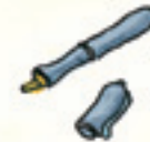
der Füller la penna stilografica