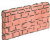
die Mauer la pared