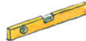
die Wasserwaage el nivel de burbuja