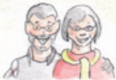
die Großeltern dziadkowie