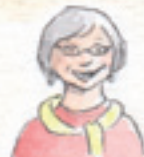
die Oma babcia