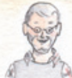
der Opa dziadek