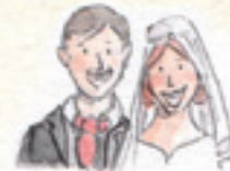
das Hochzeitspaar para młoda