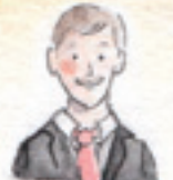
der Bräutigam pan młody