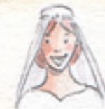
die Braut panna młoda