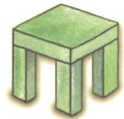
der Hocker tabure