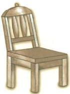
der Stuhl sandalye

Burada annem ve babamla birlikte oturuyorum. Mutfakta o'mayı seviyorum, orada annemi yemek yaparken seyrediyorum. Annem arada sırada tencereilerin içine göz atmama da izin veriyor.