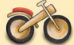
das Laufrad እታ ትድፋእ ሽግሊታ