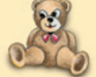
der Teddybär እቲ ባምቡላ