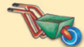
die Schubkarre እቲ ዓረቢያ