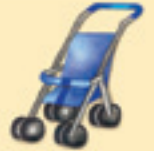
der Kinderwagen እታ ናይ ቆልዑ ዓረቢያ