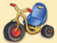
das Dreirad እታ ሰለስተ እግራ ሽግሊታ