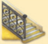
die Treppe እቲ አስካላ