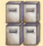
die Briefkästen እቲ ናይ ፖስታ ሳጺን