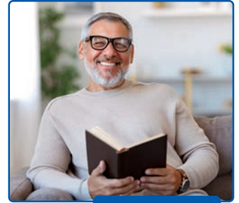
Lui ha un libro.