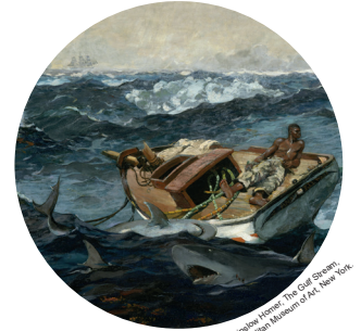
© Winook Vermeir, The Oculist, Metropolitan Museum of Art, New York

12 Comment s'appelle le sous-marin de 20 000 lieues sous les mers, de Jules Verne ?