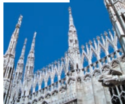
Il Duomo di Milano