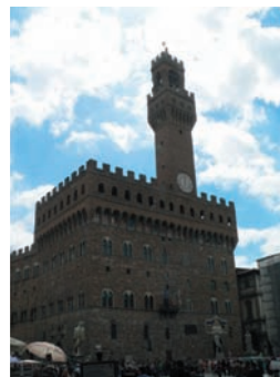
Palazzo Vecchio di Firenze