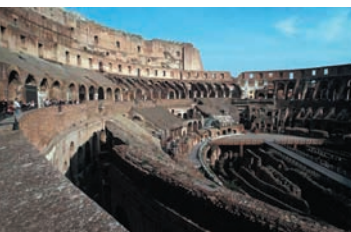
Il Colosseo di Roma