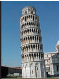
La Torre di Pisa