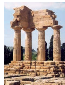
La Valle dei Templi di Agrigento