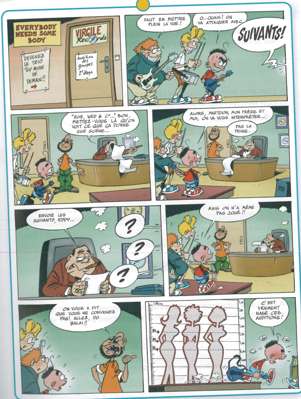
Image 4 L'audition