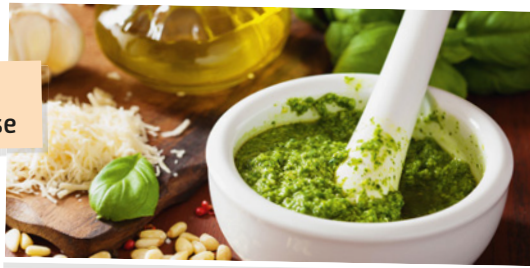
La ricetta del pesto genovese