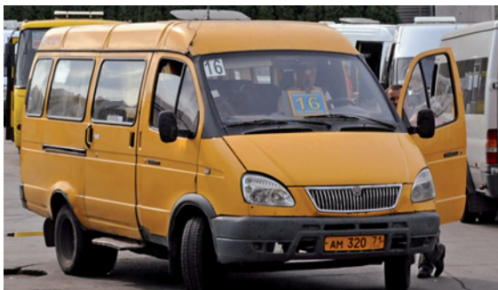
маршрутное такси / маршрутка