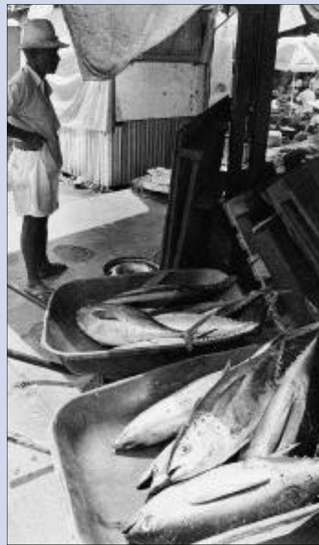
ou à Mayotte, on est loin de l'Hexagone...

département, puis la région, puis l'État qui couronne le tout. Chaque échelon de l'administration a ses propres responsabilités; par exemple, les écoles dépendent de la commune, les collèges du département, les lycées de la région et les universités de l'État, mais tout le personnel de ces différents établissements est géré par le ministère de l'Éducation à Paris... L'élection des différents responsables se fait selon des procédures électorales propres, qui peuvent même varier selon la taille des communes. Le régime des impôts n'est pas le même dans certains départements (Corse, départements d'Alsace ou de Lorraine) que dans l'ensemble de la France. A Strasbourg, les prêtres des différentes confessions (catholiques, protestants, juifs) sont payés directe-