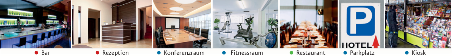
● Bar ● Rezeption ● Konferenzraum ● Fitnessraum ● Restaurant ● Parkplatz ● Kiosk

② Hotellangestellte/-r: Restaurant: Mo–Fr 6.30–22 Uhr, Sa. + So. 8–23 Uhr, Sauna im Keller, Öffnungszeiten täglich 19–23 Uhr