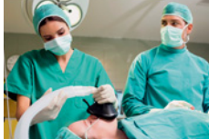
●/● Anästhesietechnische/r Assistent/-in