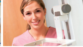
●/● Medizinisch-technische/r Assistent/-in