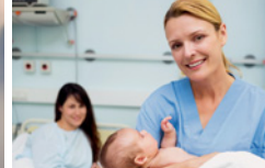
● Entbindungspfleger ● Hebamme