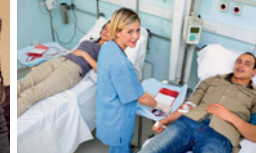
●/● Gesundheits- und Krankenpfleger/-in