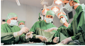
●/● Operationstechnische/r Assistent/-in