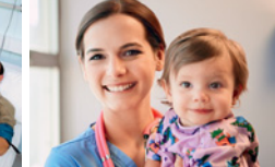
●/● Gesundheits- und Kinderkrankenpfleger/-in