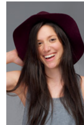
der Rock der Mantel die Hose der Hut