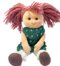
die Bauklötze (Pl.) die Playstation die Puppe die Eisenbahn