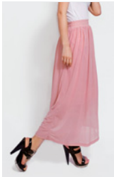
der Rock der Mantel die Hose der Hut