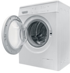
die Waschmaschine der Staubsauger der Herd die Kaffeemaschine