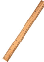
der Bleistift der Füller das Lineal die Schere