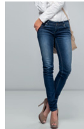
der Rock der Mantel die Hose der Hut