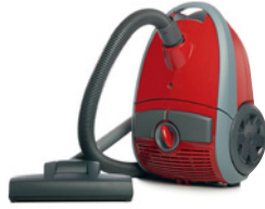
die Waschmaschine der Staubsauger der Herd die Kaffeemaschine