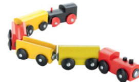
die Bauklötze (Pl.) die Playstation die Puppe die Eisenbahn

© Hueber Verlag 2016, Zwischendurch mal Hören - Waschmaschine © Thinkstock/istockphoto/olodymyr_krasnyk; Staubsauger © istockphoto/galdrer; Herd © Thinkstock/istock/ppart; Kaffeemaschine © istockphoto/duckyards; Bleistift © istockphoto/NIELSEN73; Füller © Thinkstock/istock/lineal © Thinkstock/istock/raesmleiland; Schere © Thinkstock/Dorling_Kindersley; Rock © Thinkstock/istock/ria-miya; Mantel © Thinkstock/istock/heckmannoleg; Hose © Thinkstock/istock/Kuikson; Hut © Thinkstock/istock/m-imagephotography; Bauklötze © Thinkstock/istock/Wladimir; Playstation © Thinkstock/istock/forest_s_rider; Puppe © Thinkstock/istock/svetlana_zayats; Modelleisenbahn © Thinkstock/istock/karandayev