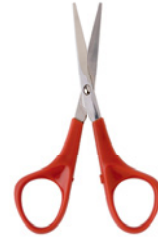
der Bleistift der Füller das Lineal die Schere