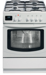
die Waschmaschine der Staubsauger der Herd die Kaffeemaschine