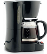
die Waschmaschine der Staubsauger der Herd die Kaffeemaschine