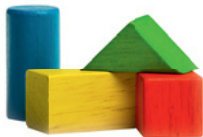
die Bauklötze (Pl.) die Playstation die Puppe die Eisenbahn