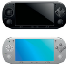
die Bauklötze (Pl.) die Playstation die Puppe die Eisenbahn