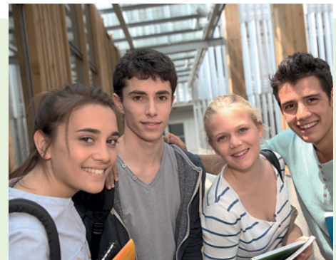
in der Berufsschule

es sehr schnell gehen, da muss man im Team gut zusammenarbeiten. Das ist manchmal ganz schön stressig, aber die Kolleginnen und Kollegen sind nett, und nach der Arbeit sind die Probleme vergessen. Sehr viel verdient man in der Ausbildung nicht, zwischen 600 und 700 Euro. Aber ich finde, es ist ein schöner Beruf.