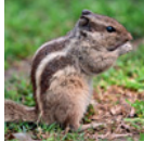
Streifen- hörnchen 25

wodurch • mithilfe • so • mittels • dadurch, dass • auf diese Weise • durch